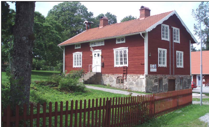
Arbetarbostaden med vällingklockan, Osaby herrgård.

Nuvarande huvudbyggnad uppfördes 1851-52 efter ritning av dåvarande ägaren, och kanske den mest färgstarke ägaren under gårdens historia, generallöjtnanten Erland Hederstierna (mer om honom lite längre fram i historien).